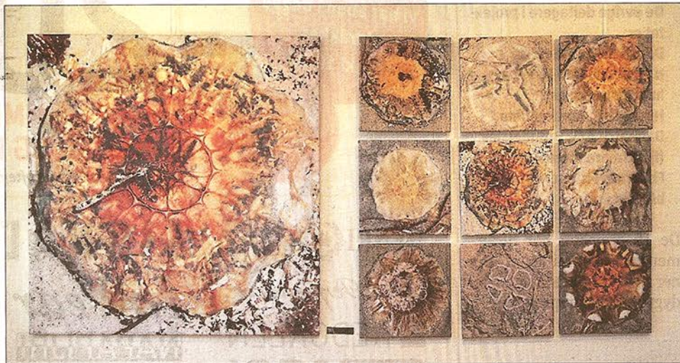
Makro fotografierne af gopler virker som en farverig eksplosion, når de bliver forstørret og overført til kanvas.

Samtidig formår Kirsten Holm at formidle og omsæt-