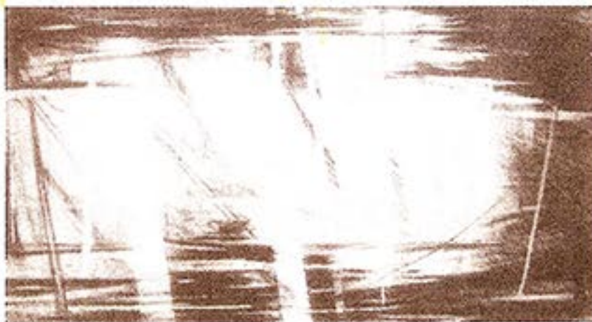
Israelskfødte Nurith Lumer-Klabbers er optaget af blyant, papir og grafit. Det er stregen og fladen der interesserer hende.

Sensommerudstillingen i Galleri Humlum kan ses til og med den 27. september.